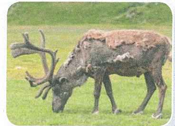
Een rendier in de ruï.

Als je gebouwen maakt, is het belangrijk dat ze zo stevig mogelijk worden. Daarom hebben mensen stevige vormen bedacht. Zo is een ijzeren plaat steviger als je hem in de vorm van een H, een L of een buis buigt. Zulke stevige vormen noem je profielen . Een H-profiel, een L-profiel of een buisprofiel dus. Als je met profielen bouwt, ontstaan stevige bouwwerken . Die bouwwerken noem je ook wel constructies . De ene constructie is steviger dan de andere. Boogconstructies zijn heel sterk. Daarom bestaan er veel bruggen met bogen. Bij ramen van kerken zie je vaak spitsbogen . Dat zijn ook boogconstructies, maar zij hebben bovenin een punt. Als je erop let, zie je ook vaak driehoeken in bouwwerken. Kijk maar eens naar bruggen, hijskranen, torens en achtbanen. Ze zijn allemaal gemaakt van driehoeksconstructies . Een heel oude en sterke constructie is de piramidevorm . Die bestaat uit een platte bodem waarop vier driehoeken tegen elkaar zijn geplaatst. De bekendste piramides staan al duizenden jaren in Egypte.