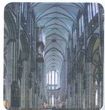
In kerken zie je vaak spitsboogconstructies.