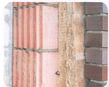
Hier zie je de isolatiedeken in de spouwmuur.

Voedsel levert energie en warmte op. Hoeveel energie er in eten zit, meet je in calorieën. De energie die je uit eten haalt, kun je opslaan als een vetlaag onder de huid. De vetlaag beschermt tegen de kou. Het vet isoleert. Ook de veren van een vogel isoleren. Tussen de veren blijft een laagje lucht zitten. Lucht is een slechte warmtegeleider. Het laat warmte of kou niet goed door. Als de vogel warm is, zorgt het luchtlaagje tussen de veren ervoor dat de warmte niet weg kan. De kou van buiten kan ook niet door het luchtlaagje. De vogel krijgt het daardoor niet koud. Glas is wel een goede warmtegeleider. Warme drank in een glas koelt daarom snel af. Behalve wanneer het glas dubbelwandig is. Dan blijft er een laagje lucht tussen de twee glaswanden staan. De lucht zorgt ervoor dat de drank heet blijft. Ook in huizen zit dubbelwandig glas. Daardoor kan de warmte uit het huis niet via de ruiten naar buiten. Het dak isoleer je door een isolatiedeken tussen de dakpannen en het plafond te stoppen. Muren worden geïsoleerd door de spouwmuur. Dat is een dubbele muur waartussen een isolatiedeken zit.