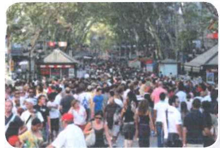
Lekker met z'n allen op vakantie.

Als je met de auto van het ene dal naar het andere rijdt, ga je over de bergpas. Dat is het hoogste punt van de weg. Maar vaak zijn er ook tunnels.