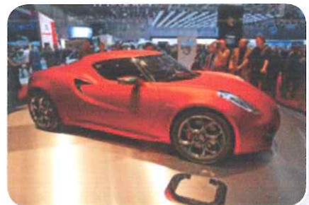
In Noord-Italië worden veel auto's gemaakt.

In het noorden van Italië zijn veel autofabrieken. Het in elkaar zetten van auto's noem je assemblage. Daarom noem je de auto-industrie een assemblage-industrie.