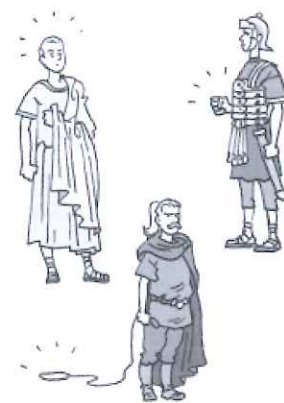
Verdeel en heers.

In 395 wordt het Romeinse Rijk in tweeën gedeeld. Steeds vaker worden de rijken aangevallen door andere volkeren. Bijvoorbeeld door de Hunnen. Veel volkeren slaan op de vlucht. Zo ontstaat een grote volksverhuizing. De Hunnen en andere volkeren vallen het Romeinse Rijk binnen. En ze winnen. Dit betekent de val van het West-Romeinse Rijk.