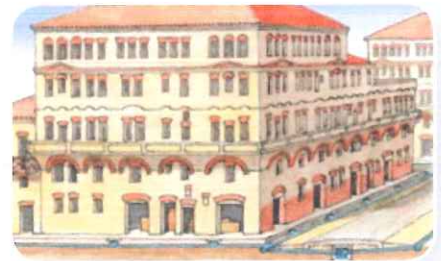
Onder de stoep ligt de riolering.

Rome heeft veel voorzieningen. Via aquaducten stroomt water naar de stad. Onder de stoep ligt een riolering. In de thermen kun je heerlijk baden.